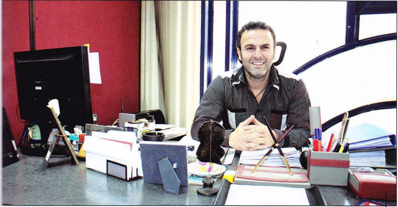
شارك ابي عبود